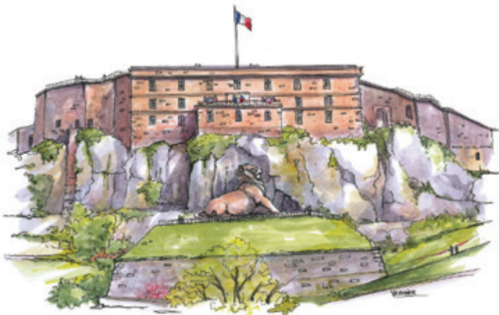
Belfort, au pays du Lion