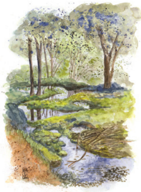
Destination, Parc national de forêts