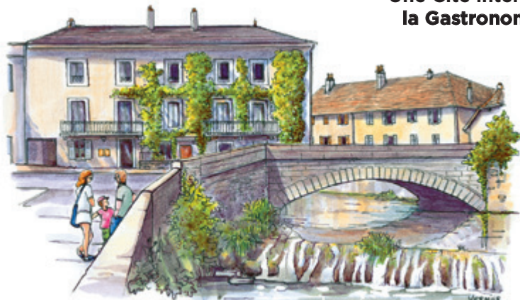
Dole, Arbois et le Jura fêtent Louis Pasteur